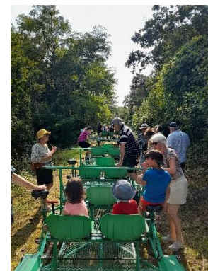
Vélorail des Mineurs (Veuxhaulles-sur-Aube)

Sur une ancienne voie ferrée de 5 km, les Vélorails des Mineurs offrent une aventure immersive au cœur de la nature, pour explorer le Châtillonnais en famille ou entre amis. Des sorties nocturnes seront proposées durant l'été pour une expérience encore plus mémorable. ( Office de Tourisme du Châtillonnais )