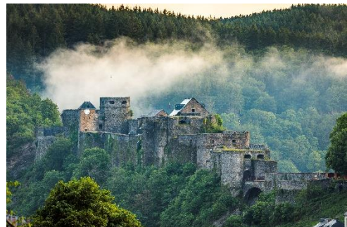
Château de Bouillon@Daniel Elke

Le Mémorial 1815 , situé à Waterloo, propose une immersion historique combinant décors multisensoriels, projections 3D, maquette géante et jeu de piste. Une visite incontournable pour les passionnés d'histoire à l'occasion de la 210 e année anniversaire de la bataille de Waterloo. (VISITWallonia)