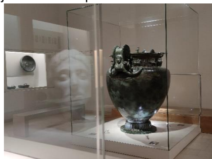
@Collections Musée du Pays Châtillonnais - Trésor de Vix

Au nord du département de la Côte-d'Or, entre Bourgogne et Champagne, se trouve le Châtillonnais un joli territoire qui offre de belles découvertes. À l'image du célèbre Vase de Vix, plus grand vase grec de